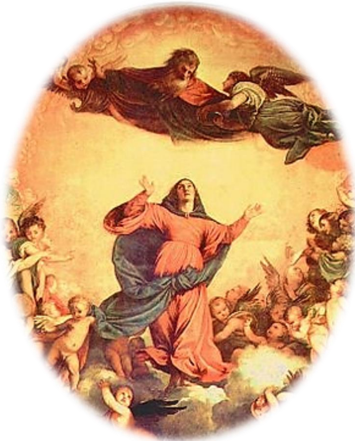
Mariä Aufnahme in den Himmel Tizian (1490 – 1576) Altarbild in Santa Maria Gloriosa dei Frari in Venedig

PFARREI ST. GEORG AMBERG Pfarrbrief vom 5. bis 27. August 2017