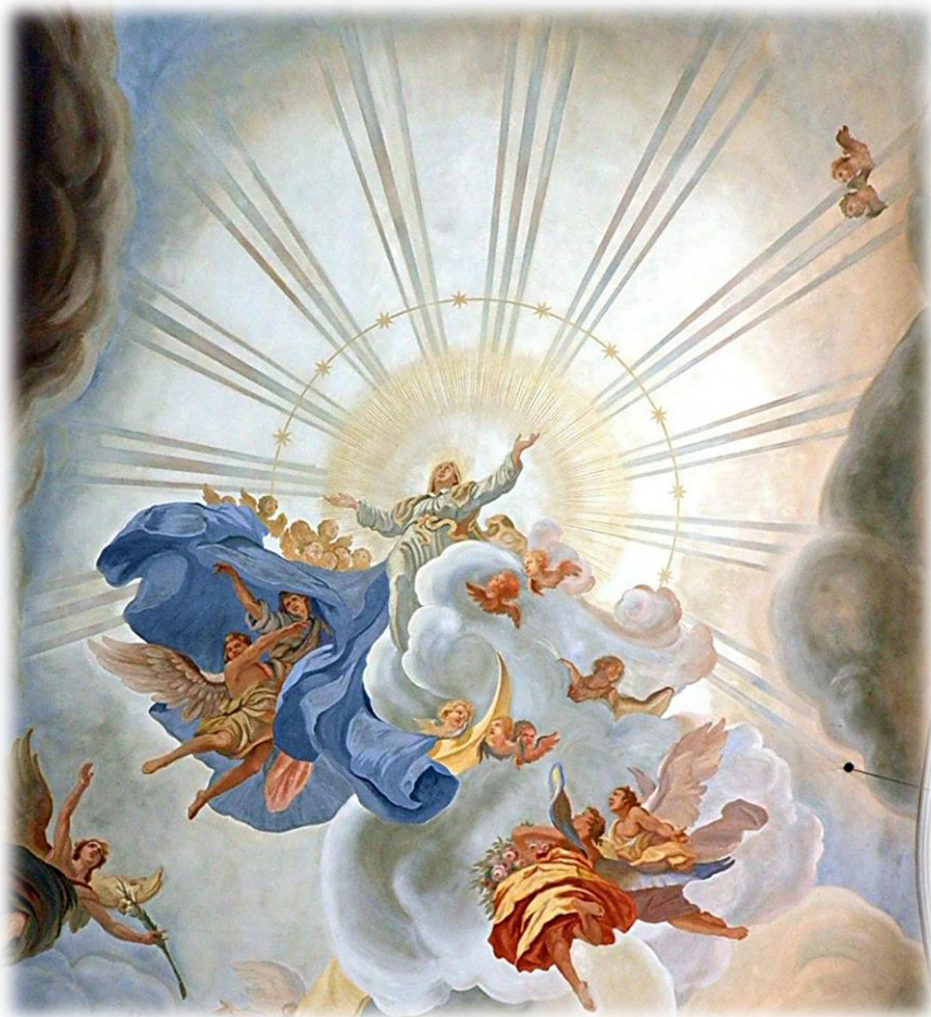
Aufnahme Mariens in den Himmel

Pfarrbrief vom 3. August bis 1. September 2024