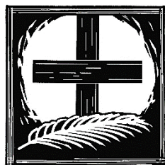
Palmsonntag „Gelobt sei, der da kommt ...“

DIE DREI ÖSTERLICHEN TAGE VOM LEIDEN UND STER- BEN, VON DER GRABESRUHE UND DER AUFERSTEHUNG DES HERRN