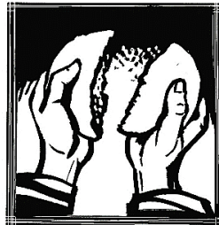
Ostermontag „Brannte uns nicht das Herz?“