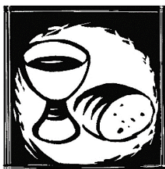
Gründonnerstag „Tut dies zu meinem Gedächtnis.“