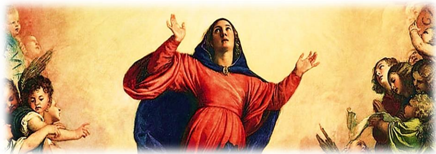
Tizian (1490 - 1576)

Gottesdienste mit Kräuterweihen sind seit dem 9. Jahrhundert bekannt und lösten germanische Erntebräuche ab. Volkskundler führen die Tradition von Blumen- und Kräuterweihen auf Geschichten um die Blumenliebe Marias zurück. Ebenso wird sie mit der legendären Öffnung des Grabes der Gottesmutter in Verbindung gebracht. Statt eines Leichnams, so die Legende, fanden die Apostel darin Blumen und Kräuter. Der Erde soll an dieser Stelle ein wundersamer Duft entströmt sein.